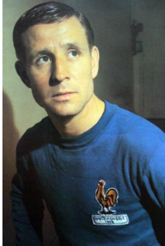
Раймон Копа -

Первый игрок сборной Франции, получивший «Золотой мяч», 1958 г.